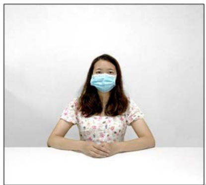
图2：正前方第一机位效果图