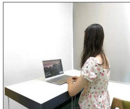
图3：侧后方第二机位效果图