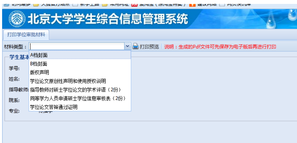
图 4 学生打印学位审批材料页面

《版权声明》、《学位论文原创性声明和使用授权说明》、《指导教师对硕士学位论文的学术评语》导师评语要求两份导师签字的原件。在答辩前交到院系教务老师处。